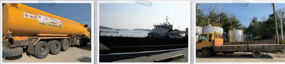
25톤 탱크로리 등 차량 10대 자산보유

41년 전통의 석유화학제조와 폐기물 처리장제의 원천기술을 보유한 코스람 산업은 귀사에서 사용하는 세척제를 진공유수 분리를 통해 재활용 정제, 첨가 후 99% 세척제로 귀사용으로 납품(50%절감), 동등 세척제 성능 구현 서비스는 국내 유수의 대기업, 중소기업 등 협력, 공조하고 일본, 대만, 동남아 등 해외로 수출하고 있습니다.